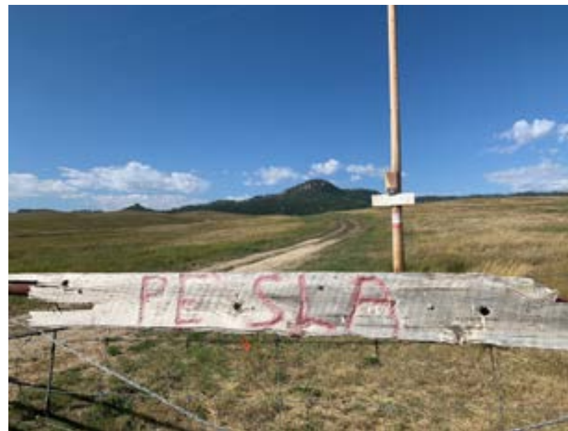
Posvátné území Phešlá. Vstup zakázán

Zlatou horečku už nikdo nezastavil. Trvala několik let a pak skončila, dnes zejí vytěžené doly prázdnotou a okolní města chřadnou. Nicméně, od začátku bylo jasné, že je něco špatně. Vláda se několikrát pokusila kmenům ztrátu Black Hills kompenzovat. V roce 1980 nejvyšší soud rozhodl, že vláda spojených států dluží prérijním kmenům 106 milionů dolarů, dnes by