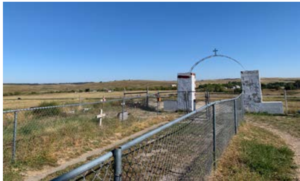
Hřbitov ve Wounded Knee. Naposledy se tu střílelo před půl hodinou

Memoriál končí a smuteční hosté odjíždějí. Jdeme se podívat na hřbitov, teď už je to bezpečné. Hřbitov je velmi posvátné místo, ale není to moc znát. Místo, kde jsou pohřbené oběti masakru, je oplocené, ale nejsou tu žádné náhrobky. Kromě velké červené cedule u silnice tady vlastně historii nepřipomíná vůbec nic. Není tu žádný památník, což není pro Ameriku typické.