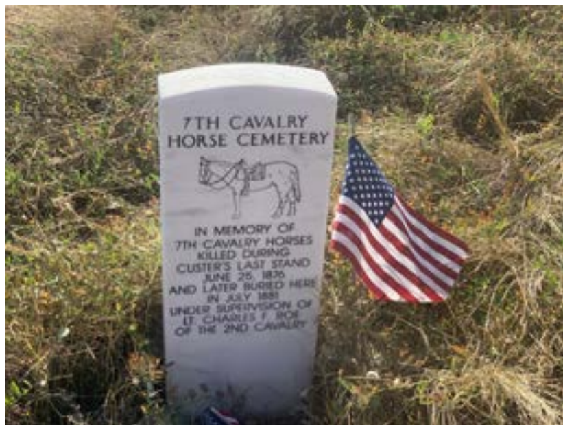
Wašiču koně mají svůj pomníček

jich zvykem, snažili se rychle zabít velitele. To se povedlo, Tom Custer zde padl a zbytek kavaleristů ve zmatku ustupoval. Tady někde převzali natives iniciativu a vytvářeli tlak na ustupující kavaleristy. Schylovalo se k rozhodující části bitvy.