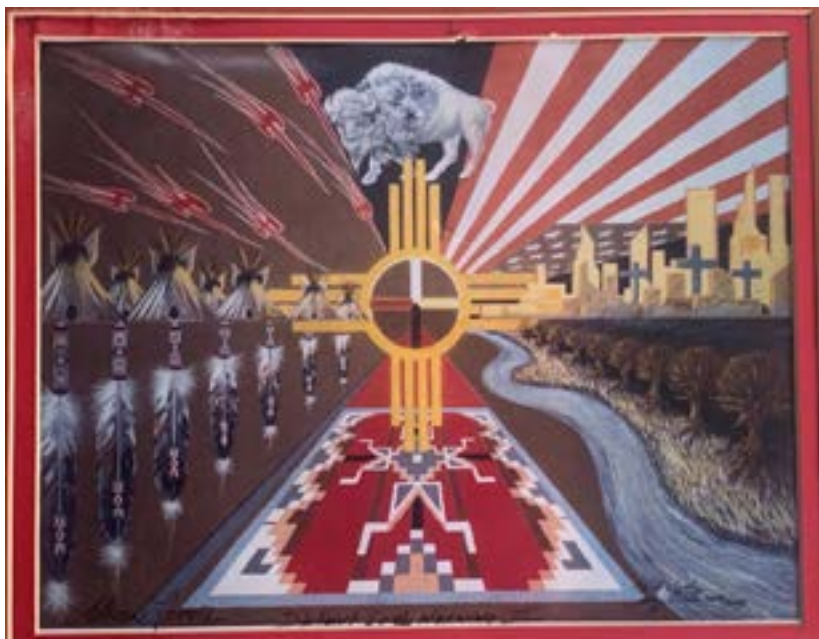
Hřbitov ve Wounded Knee. Obraz od Adriana Larvie

tives čekají pouze předsudky, nespravedlnost a potom smrt. Pod tím je bahnitá řeka Missouri, která tvoří východní hranici území Lakotů. Její východní břeh je pustý, zatímco na západním břehu rostou krásně stromy a je tam báječně.