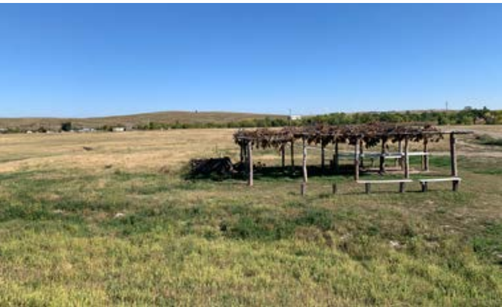
Tady se to stalo. Místo, kde se odehrál masakr ve Wounded Knee

Peníze nazpátek nemají, dnes ještě nic neprodaly. Ptáme se jich na ten obřad na hřbitově. Prý je to memoriál za někoho, kdo se zastřelil. Nemělo by se u toho střílet, říkají, nehodí se to. Jednou nebo dvakrát se mi zdá, že mezi jednotlivými výstřely slyším krátkou dávku ze samopalů. Zbraně jsou v Jižní Dakotě velmi dostupné.