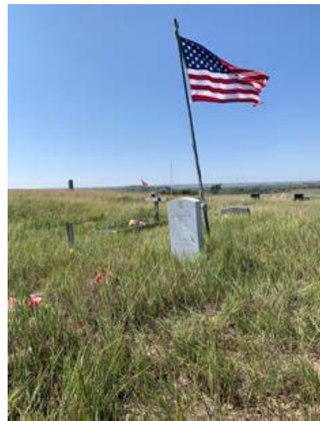
Hřbitov v rezervaci

Ona ta příroda je přece jenom trochu dotčená člověkem vašiču. Už tu nemigrují stáda bizonů, která dříve tvořila hlavní zdroj obživy prérijních nativů. Původní obyvatelé prémie proto ztratili důvod stěhovat se za stády, bydlet v týpí, dodržovat staré zvyky a tak. Dělo se to postupně, jak vašiču projížděli prérií dál na západ, kde čekala bájná Kalifornie. Opravdu, projížděli. Prémie jsou liduprázdné dodnes, moc vašiču se tu neusadilo. Osud původních obyvatel prémie nebyl vašiču, reprezentovanými Velkým Bílým Otcem ve Washingto-