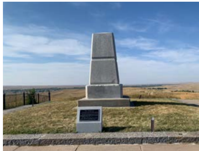
Tady heyókové zastřelili George Armstronga Custer

Sedmá kavalerie se před bitvou rozdělila na několik částí. První z nich velel jakýsi Reno. Reno chystal útok na tu část tábora, kde bydleli kmenoví starší a bylo tam také pár mladých chlapců, kteří se starali o koně. Starší převzali velení. Koňákům