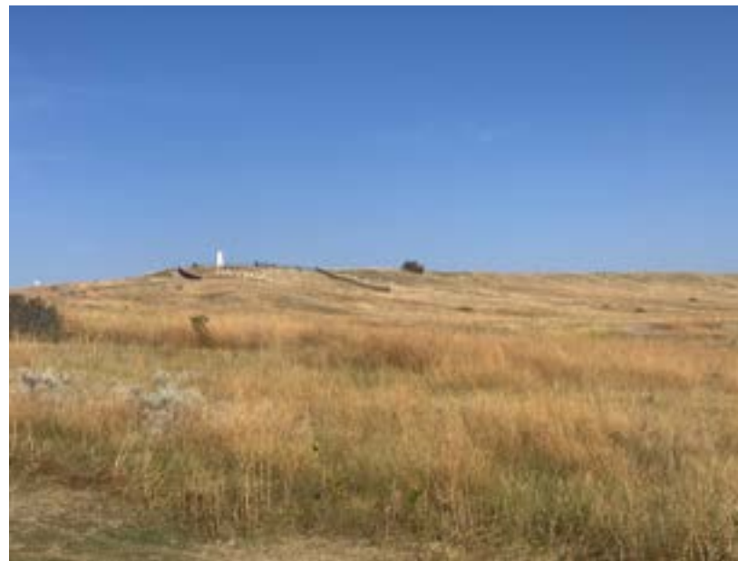
Závěr bitvy se odehrál na nevysokém návrší

Ustupující kavaleristi se zformovali a postavili se na odpor. Pro Natives to nevypadalo dobře, kavaleristi stáli pevně na svých pozicích a odmítali ustupovat. Tady, podle vyprávění Lakotů, zasáhl válečník Crazy Horse. Crazy Horse měl při posledním Tanci vizi, že zemře sice brzy, ale ne v bitvě. Vzal si z toho to lepší a nebál se. Podnikl několik sólo útoků na postavení kavaleristů. Neřešil, že po něm střelí, věděl, že se mu nemůže nic stát. Jednou dojel ke kavalérii tak blízko, že vojáka v přední řadě srazil