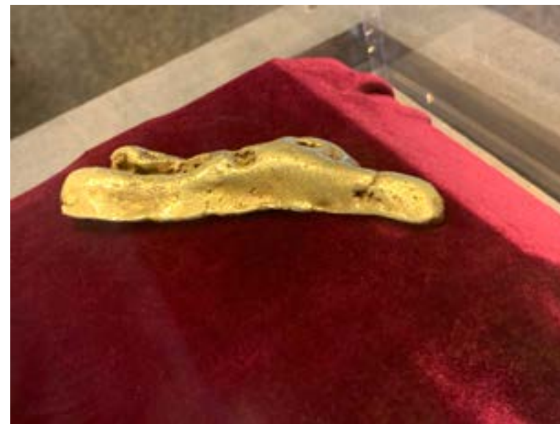
Zlatý nuget v muzeu

A právě v téhle smlouvě byly Black Hills určeny jako území prérijních kmenů, kam by wašíči neměli vůbec strkat nos. Šest let to fungovalo.