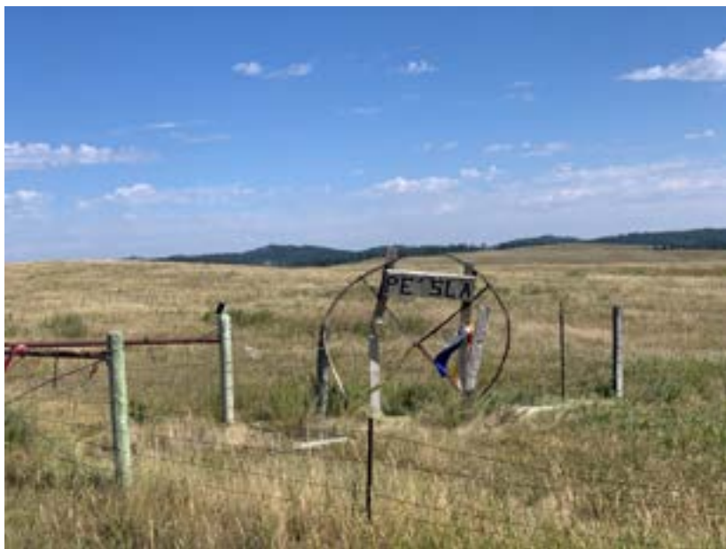
Phešlá je lakotsky plešatý