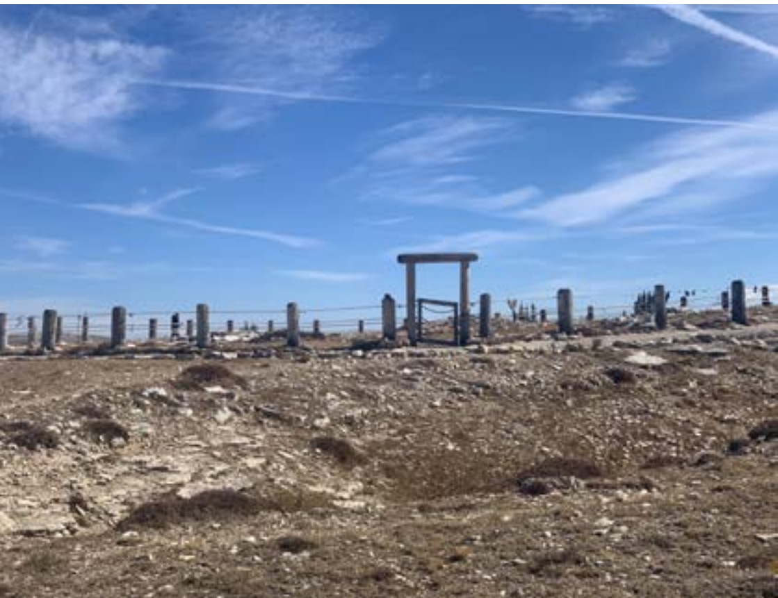
Medicine Wheel. Za plot se nesmí