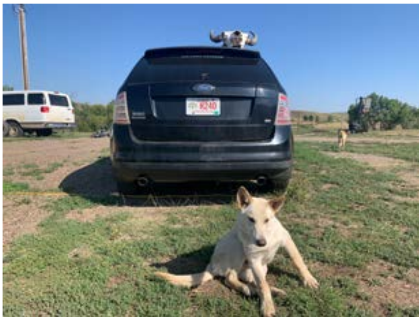
Některá auta jsou pojízdná

nás asi šest nebo sedm psů, jsou velmi přátelští. K dispozici je polní kuchyně, jako na skautském táboře. Nic nám nechybí.