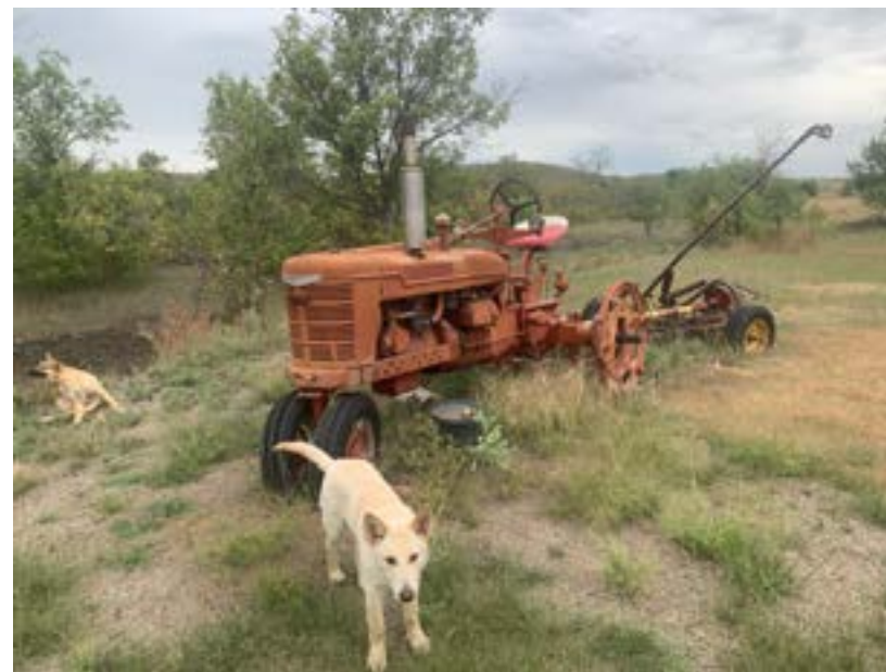
Našlo by se tu leccos. V popředí můj věrný průvodce

Než dorazí naši hostitelé, jedeme si prohlédnout okolí. Cesty v rezervacích jsou většinou bez asfaltu, ale jsou solidně zpevněné. Nic moc tu není, jenom hřbitov zarostlý trávou. Nad vojenským náhrobkem vlaje vlajka. Hodně natives slouží v armádě, v letectvu nebo v národní gardě.