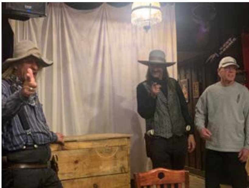
Hrajeme si na smrt Wild Bill Hickoka

to taky znamená Ten, co vždycky chce něco získat. Je vidět, že Lakotové o nás mají dobré mínění.