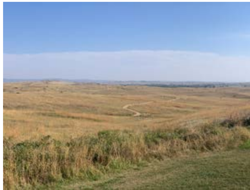
Blízko Tučné Trávy

George Armstrong Custer stál na svém posledním stanovišti, obklopen zbytkem sedmé kavalerie. Vojáci začali zabíjet své koně, aby získali alespoň nějaké krytí před palbou. Natives měli čas, nic jim nemohlo utéct. Crazy Horse uvažoval strategicky. Zabijeme je všechny, ale Custeru necháme žít, aby ostatním naši-ču mohl vyprávět, jak tady dopadl. Vydal všem bojovníkům rozkaz, aby nestříleli na Custeru. Všichni poslechli. Mezi bojovníky byli ovšem dva heyókové, kteří poslechli taky, ale udělali opak. Oba okamžitě po Custerovi vystřelili a oba se trefili. Custer padl mrtev. Lakotské prameny uvádějí, že Crazy Horse rezignovaně zavrtěl hlavou jako by říkal to nééé.