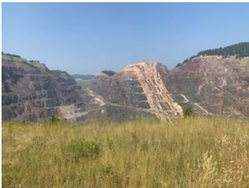
Dávno vytěžený zlatý důl

je. Dbal při tom na to, aby jejich mrtvá těla ležela na stezkách a byla tak upozorněním pro další wašiču, aby sem už nechodili. Nechápal, na co je ten žlutý prášek, po kterém se zlatokopové pídí, ale moudře ho shromažďoval v jedné jeskyni. Tohle zlato bylo později použito na nákup pušek, ze kterých natives stříleli na sedmou kavalérii u Tučné Trávy.